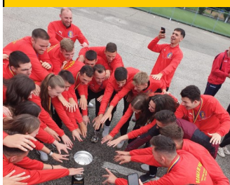
Bucurie la Drăgășani