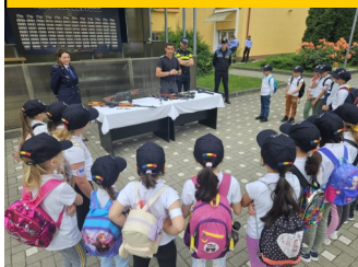
Școala "Nicolae Titulescu"