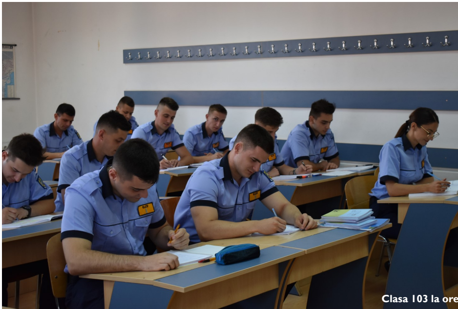
Clasa 103 la ore