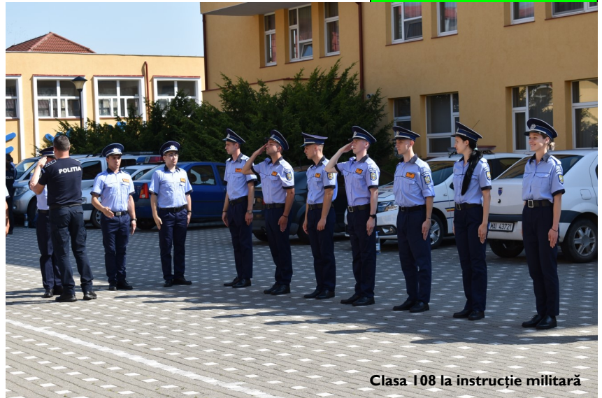
Clasa 108 la instrucție militară

02.07.2023 - ziua mea norocoasă - după lungi antrenamente și studiu intens, mi-am făcut bagajul și am ajuns fix în camera 205. Până aici m-au condus părinții și sora mea, de aici încolo dorința mea este de a mă putea conduce singură pe drumul pe care l-am început. Timidă, cu un troler greu, am ajuns în cameră, singură (norocoasă, pentru că am putut să-mi aleg prima patul), mi-am așezat cu grijă lucrurile, mai ales uniforma mult dorită, pe care tocmai o primisem. În timp ce îmbrăcam uniforma, subit, inima a început să bată mai tare și toate gândurile, emoțiile și visele legate de drumul pe care voi merge m-au năpădit. Îmbrăcată în ea, am simțit ce înseamnă să fii polițist - cum te transformi și cum îți schimbi atitudinea, cum reprezinti domeniul și cum devii mândru să fii parte dintr-un colectiv. Plângând de bucurie, sorbeam și savuram imaginea pe care o vedeam în oglindă, cu zâmbetul până la urechi. Mi-am promis că așa voi