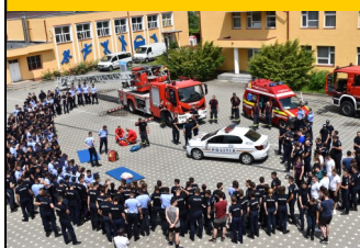
Demonstrație ISU Cluj