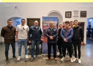
Lansare de carte