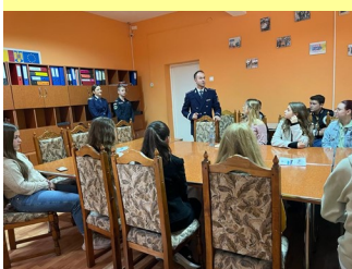
Promovare la Jibou

- 02.10.2023: Școala de Agenți de Poliție "Septimiu Mureșan" Cluj-Napoca organizează o nouă campanie voluntară de donare de sânge, în sala de sport a școlii, cu sprijinul Centrului Regional de Transfuzii Sanguine Cluj. Participă 92 de elevi și cadre ale școlii;