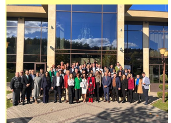
FOOD la final