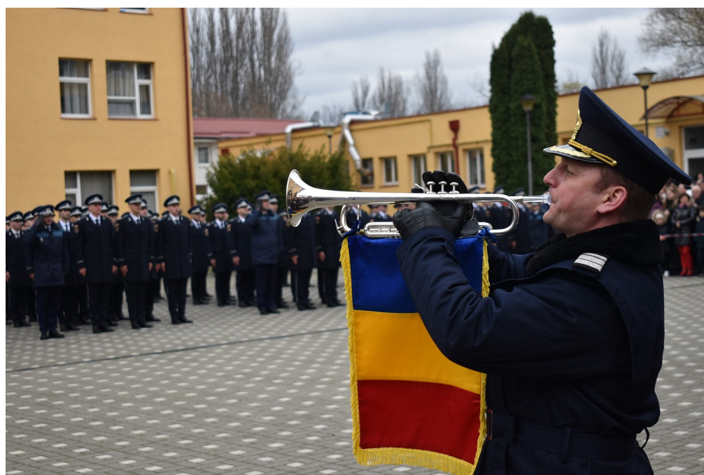
Ultima "stingere" pentru promoția 22