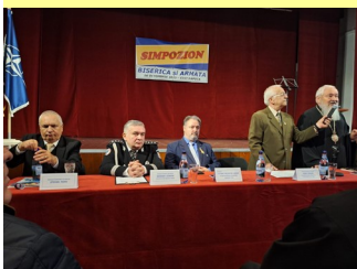
Biserica și Armata