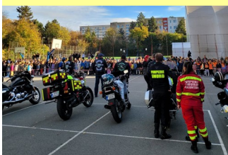
Pasiuni pe două roți