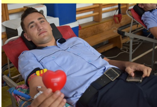
Donare de sânge