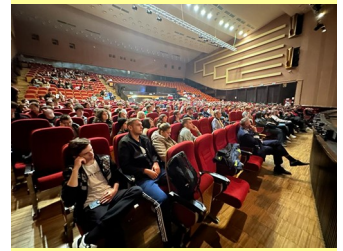
Mai responsabili în trafic

(pagini realizate de comisar-șef de poliție ALICE POPA)