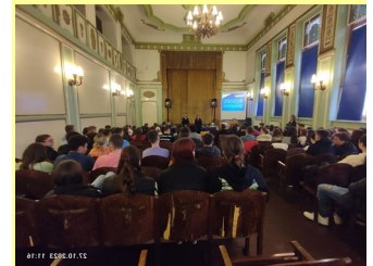
Promovare la Satu Mare