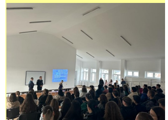
Promovare în jud. Suceava