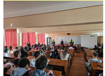
Promovare la Șimleu